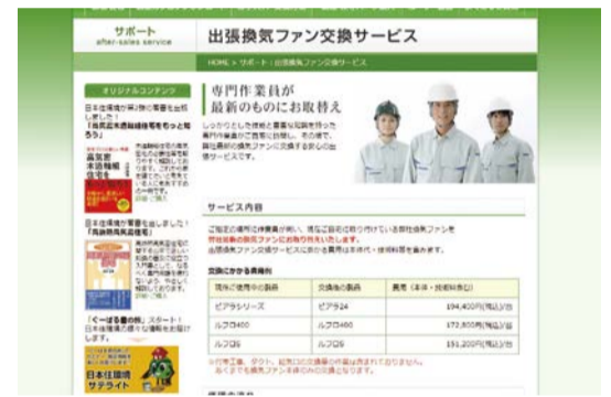
ファンの交換はエンドユーザーが直接申込みできる

グリルの開口面積を9段階で調節できるので、部屋の大きさに応じた換気風量設定がしやすい。