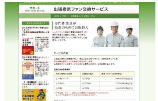
ファンの交換はエンドユーザーが直接申込みできる

グリルの開口面積を9段階で調節できるので、部屋の大きさに応じた換気風量設定がしやすい。